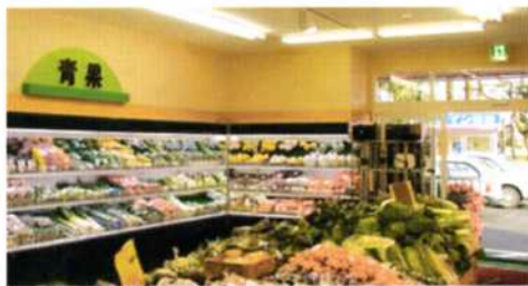
スーパーマーケット(SIC20200・20205) コンビニエンスストア(SIC20200・20205)